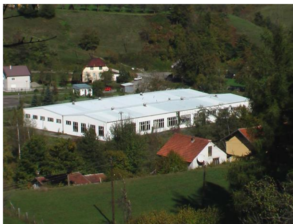
Slika 4. Objekti Kipsa