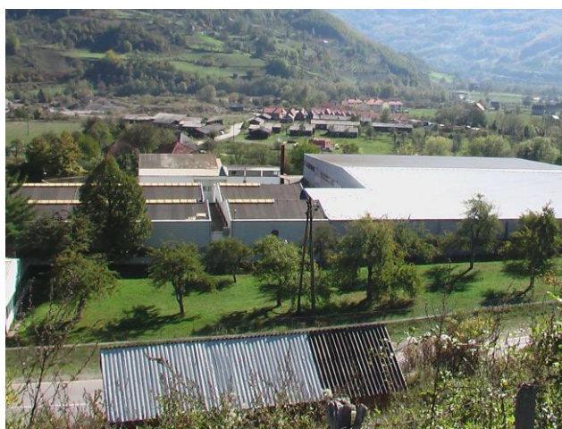
Slika 3. Objekti Soko Štarka

Takođe, objekti Kipsa i magacin Soko štarka (poslovni prostor 12000\text{m}^2 i dvorišni prostor 10000\text{m}^2 ) koji zauzimaju velike površine neiskorišćeni su, dok je kompletna infrastruktura na zavidnom nivou.