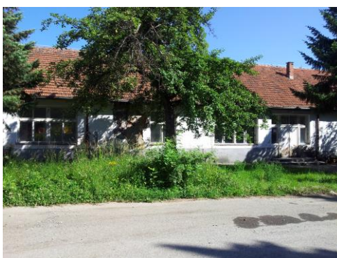
Slika 2. Objekti Kasarne

Površina objekata je 12.942\text{m}^2 a kvalitet infrastrukturne i urbanističke uređenosti je na zadovoljavajućem nivou.