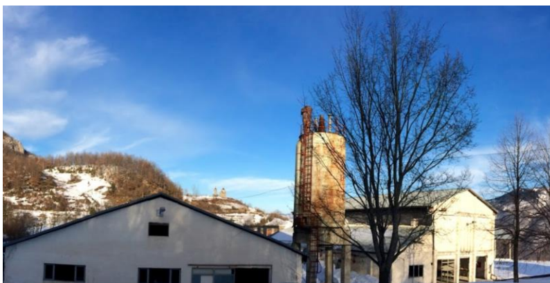
Slika 1. Objekti bivše fabrike „Mermer“

Površina objekata je 12.942\text{m}^2 a kvalitet infrastrukturne i urbanističke uređenosti je na zadovoljavajućem nivou.